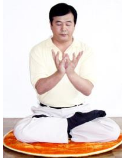
Lotus El Pozisyonu