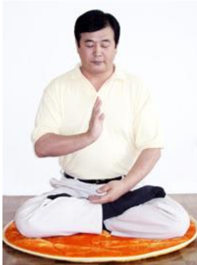
Tek Elin Dik Tutulması